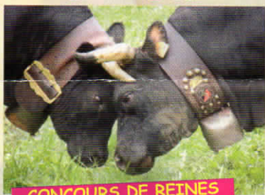
CONCOURS DE REINES